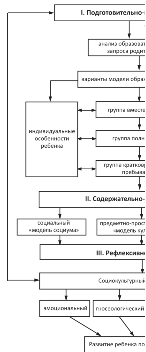
Рис. 3. Алгоритм организации социокультурной образовательной среды по вектору амплификации развития детей раннего возраста [44; 58]